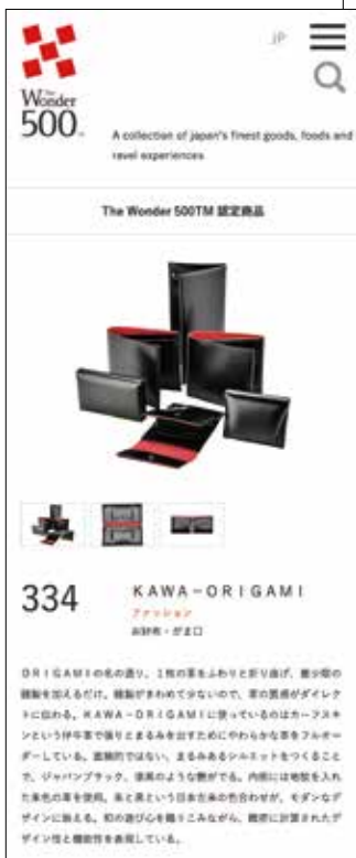
スマートフォンビュー

目的別にお問い合わせできます。 - ストーリーや写真データの利用 - 高解像度の写真データ依頼 - 事業者へのお問い合わせ 等